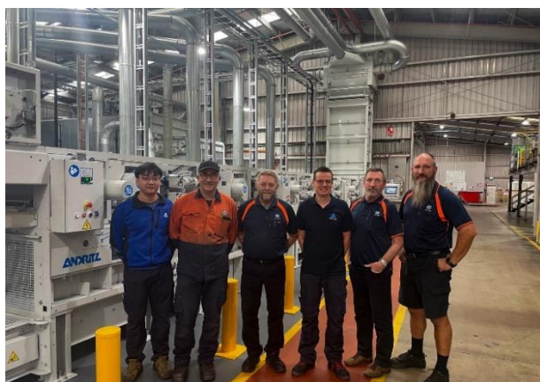
Teams von Sealy Australia und ANDRITZ vor dem 6-Zylinder-EXEL-Modul